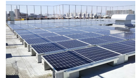
置き基礎設置 (陸屋根)