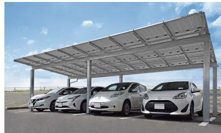
ソーラーカーポート